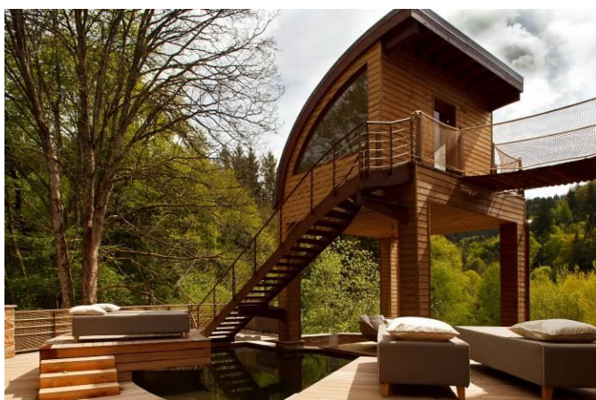
Le sauna sur pilotis

Après avoir remporté le Prix Villégiature 2014 du « Meilleur Spa d'hôtel en Europe », la Cheneaudière & Spa a obtenu le Trophée International du Meilleur Spa Relais & Châteaux 2016.