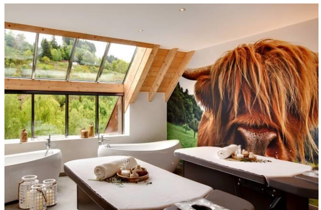
La suite de soins Prairie