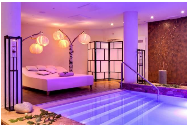
Le flotarium, pour une expérience sensorielle

Entre chaque soin, chacun pourra profiter du Nature-Spa de 2.500 m2 avec notamment 4 piscines, 5 saunas, 1 grand hammam-ruche, 1 sauna tonneau, un bain bois, des douches à sensations, une plage pétillante,... Chaque jour les hôtes trouveront dans leur chambre une tisane bienfaisante aux plantes calmantes élaborée par l'herboriste de la maison.